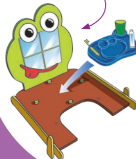
Le jeu des 7 familles de Clément